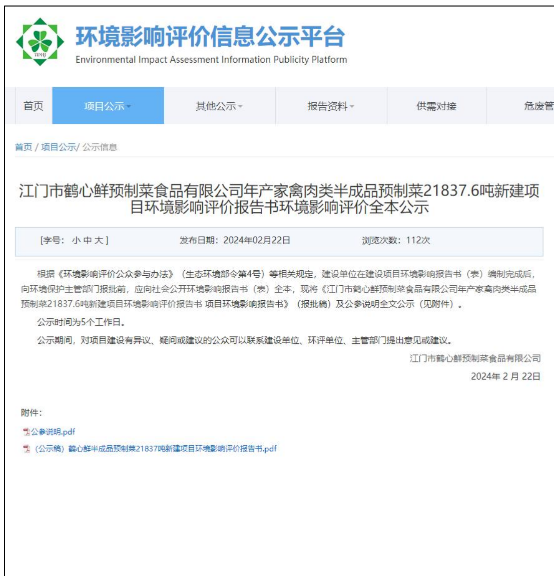
图 4-1 报批前网络公开截图