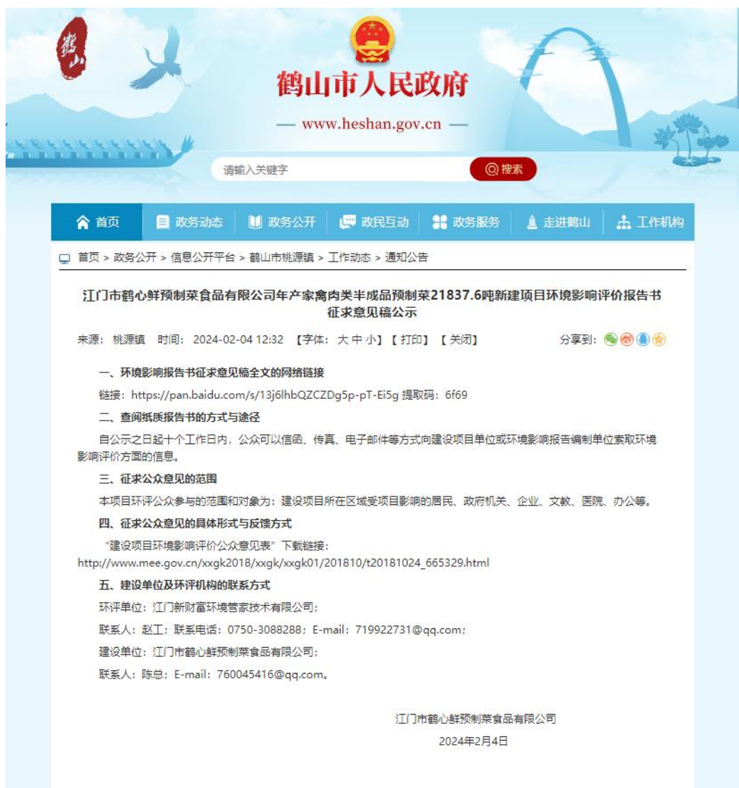
图 3-1 第二次环保公示网络截图

第二次环保信息公示、电子版《江门市鹤心鲜预制菜食品有限公司年产家禽肉类半成品预制菜 21837.6 吨新建项目环境影响评价报告书（征求意见稿）》、《建设项目环境影响评价公众意见表》的下载链接通过鹤山市人民政府网站进行了发布。网络公示截图见图 3-1。