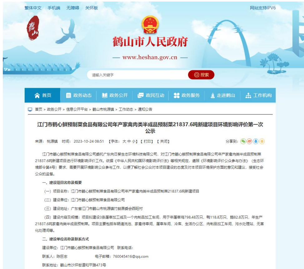
图 2-2 第一次环保公示网络截图

第一次环保信息公示在企业官方网站上公示，网络公示网址为 https://www.heshan.gov.cn/zwgk/xxgk/hsstyz/gzdt/tzgg/content/post_2962072.html ，公告截图见图 2-2。