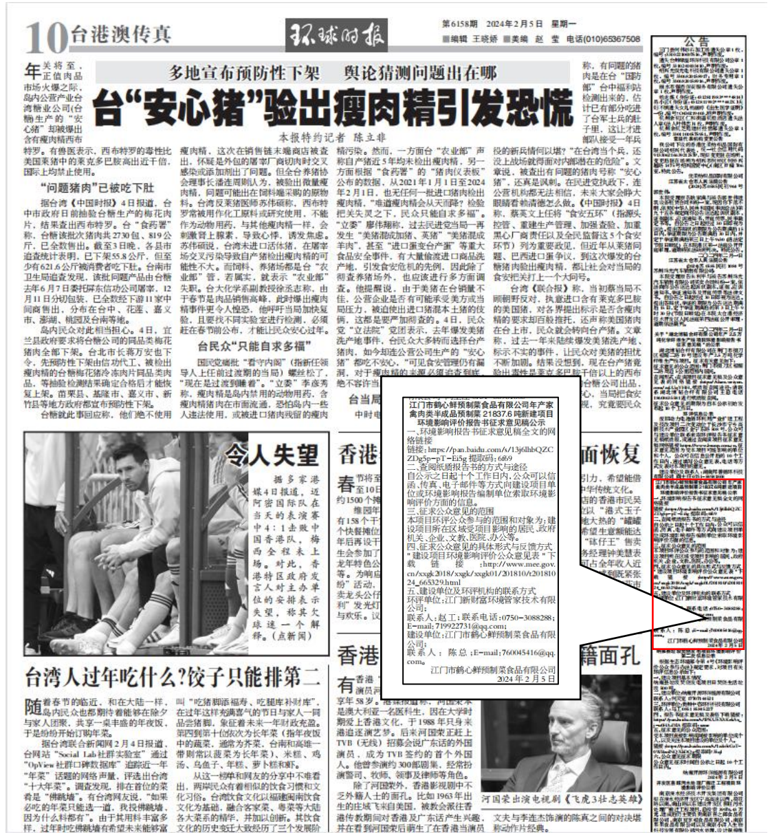
图 3-2 环球时报第一次报刊公示截图

第二次环保信息公示在《环球时报》报刊上发布了2次，时间分别为2024年2月5日、2月6日。符合《环境影响评价公众参与办法》要求的第二次环保公示发布2次报纸公示的要求。